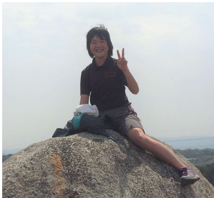
颯走17号の時に提供いただいた写真

ことになります。水平方向への走りやすさは求めていないため、競技会においては急峻でテクニカルな斜面や標高2000m以上の高山をコースにする場合が多くなります。(日本スカイランニング協会ホームページより抜粋)