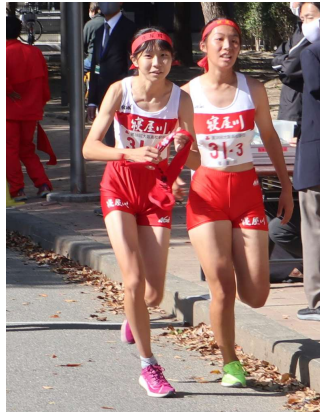
女子駅伝3区から4区へ